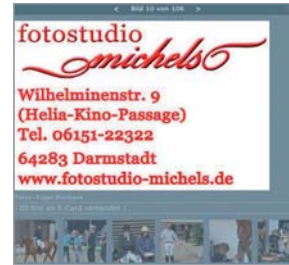
Preis: 120 Euro pro Galerie Format: 420 x 279 px

Ihre Werbung wird nach jedem zehnten Galeriebild eingeblendet.