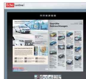
Preis: 100 Euro/Woche

Digitaler Prospekt In der Zeitung sind Beilagen attraktiver Lesestoff. Diese Werbeform hat auch im Online-Medium an Bedeutung gewonnen. Echo Online präsentiert Ihre Angebote attraktiv im Flash-Format im geeigneten Umfeld.